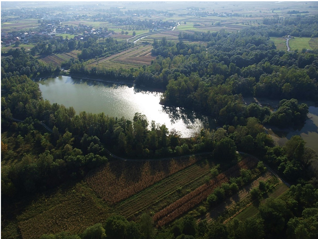
Slika 10. Krajoblik grada Sveta Nedelja

Velik dio obradivog zemljišta je neiskorišten i zapušten, a njegovoj komercijalnoj upotrebi prvenstveno stoji na putu velika usitnjenost parcela.