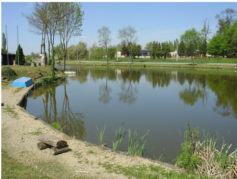
Slika 3. Jezero Kerestinec

Grad nedovoljno valorizira prostor oko jezera, kao i prostor oko Dvorca Kerestinec (nekadašnji vojni poligon) koji uz Svetonedeljski breg potencijalno predstavljaju lokacije za sportsko-rekreativne sadržaje.