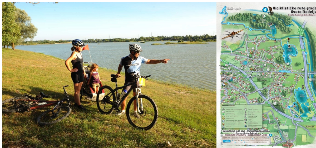
Slika 8. Biciklističke rute

Turistička infrastruktura slabo je razvijena, pa se uz jezera gostima nudi zasad samo opcija biciklističkog obilaska po postojećim rutama (za popis vidi 2.2.9.), za koje je Strategijom razvoja Urbane aglomeracije Zagreb predviđeno povezivanje u cjelinu s rutama koje vode iz grada te ostalim stazama u aglomeraciji. Poučne pješačke staze postoje na Svetonedeljskom bregu te u Ornitološkom rezervatu.