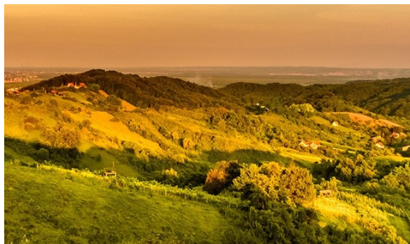
Slika 11. Svetonedeljski breg

Grad Sveta Nedelja smješten je u prostoru savske doline i najistaknutijih sjeveroistočnih obronaka Samoborskog gorja – Svetonedeljskog brega.