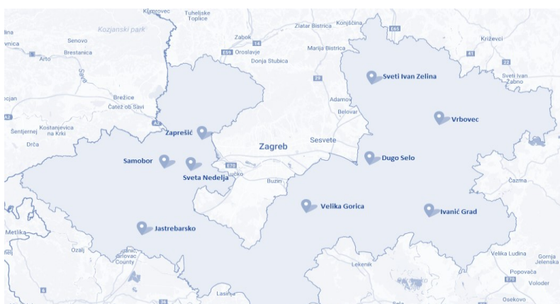
Slika 4. Gradovi Zagrebačke županije

U sastavu Zagrebačke županije devet je gradova: Dugo Selo, Ivanić Grad, Jastrebarsko, Samobor, Sveti Ivan Zelina, Sveta Nedelja, Velika Gorica, Vrbovec i Zaprešić te 25 općina. Promatrajući rezultate poslovanja poduzetnika na razini Zagrebačke županije može se zaključiti da se prema kriteriju broja zaposlenih i ukupnih prihoda posebno ističu poduzetnici Velike Gorice i Svete Nedelje.