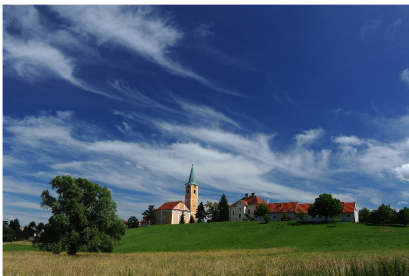
Slika 2. Crkva Presvetog Trojstva

U gradu djeluje niz organizacija civilnog društva posvećenih kulturnim zbivanjima, povezanih u Zajednicu kulturno-umjetničkih udruga. Gradu, međutim, nedostaje poprište za kulturna događanja i društveni život, mjesto na kojem bi brojne udruge građana imale priliku pokazati svoju produkciju te gdje bi se mogle odvijati kulturne manifestacije i gostovanja.