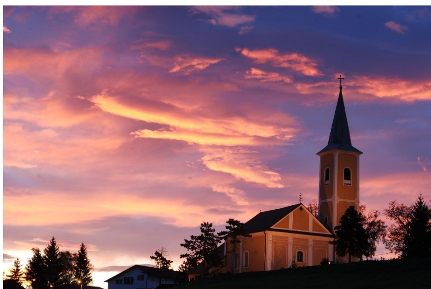
Slika 7. Župna crkva Presvetog Trojstva