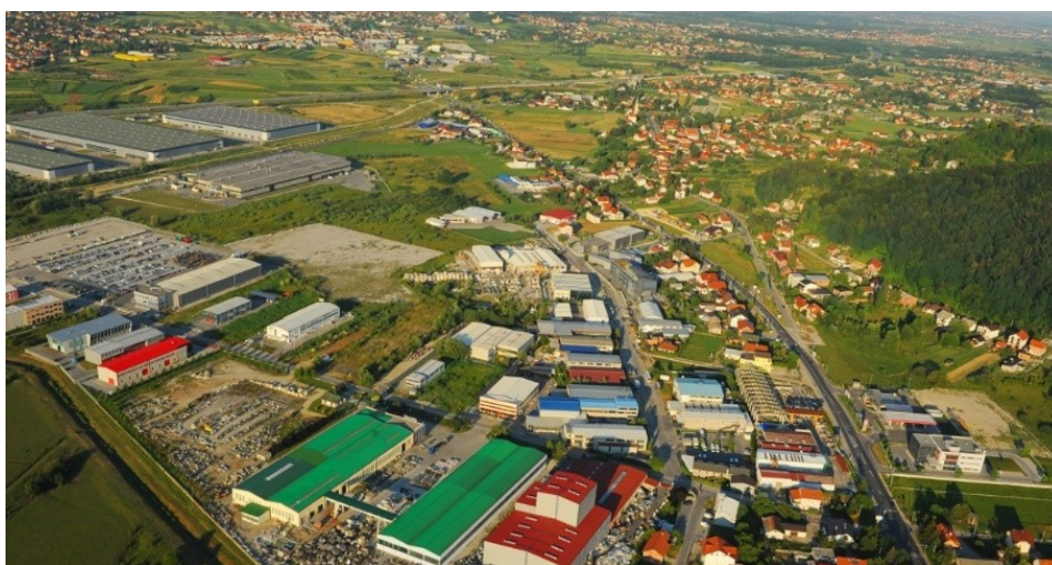
Slika 5. Poduzetnička zona grada Sveta Nedelja

Sukladno tome, iako je u gradu Sveta Nedelja najjača djelatnost trgovina na veliko i malo, profil svetonedeljskih poduzeća usmjerenih ka proizvodnji pokazuje kako su IT industrija, prerađivačka industrija (osobito automobilska industrija) te djelomično i proizvodnja lijekova i medicinske usluge već sada prepoznatljivo lice svetonedeljskog gospodarstva, te da su ti sektori i djelatnosti potencijalna osnova daljnjeg strateškog razvoja gospodarstva.