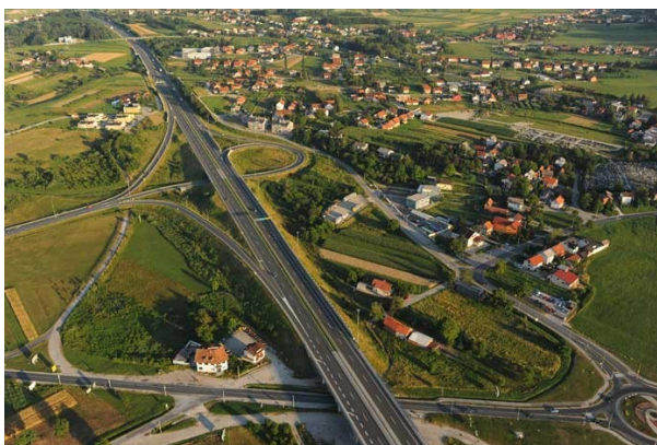
Slika 12. Prometna infrastruktura grada Sveta Nedelja

Državna cesta DC231, spaja prostor Grada sa Samoborom, a državna cesta DC1 prolazi uz južni dio obuhvata. Županijske i lokalne ceste na prostoru Grada povezuju naselja sa prostorom Zagrebačke županije i Republike Hrvatske.