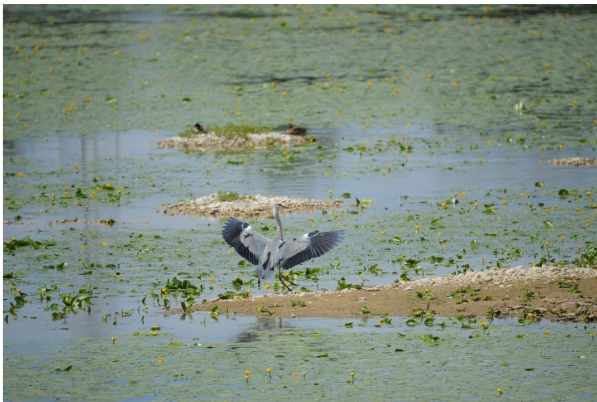
Slika 13. Ornitološki rezervat Strmec - Sava

Osobito vrijedno područje jest ornitološki rezervat Strmec-Sava. Područje Strmec-Sava zaštićeno je 1971. godine. Unatoč zahvatima u neposrednoj blizini očuvana je autohtona šuma i šikara priobalja Save, gdje obitavaju brojne ptičje vrste i druga fauna. U dijelu rezervata očuvan je prirodni tok rijeke Save s meandrima i rukavcima.