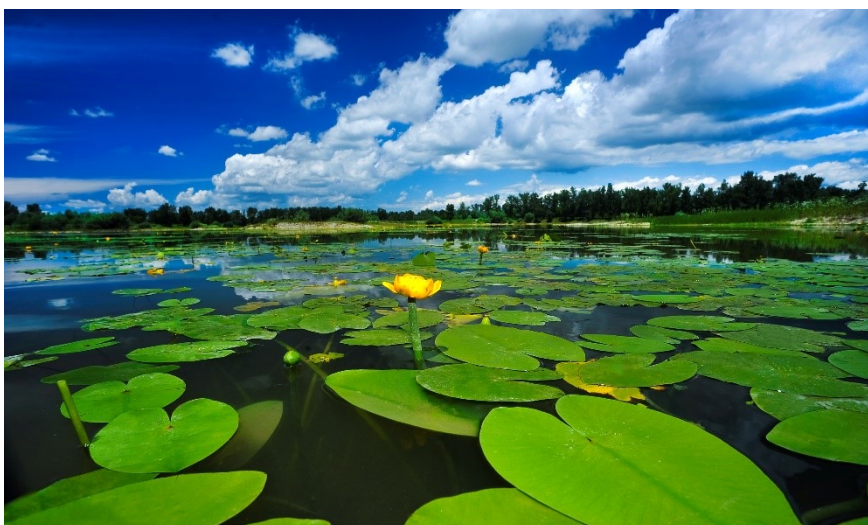
Slika 6. Jezero Orešje