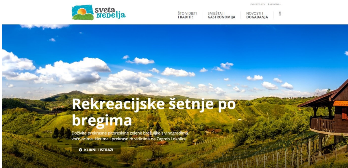
Slika 9. Web stranica Turističke zajednice grada Sveta Nedelja

U Svetoj Nedelji djeluje Turistička zajednica koja skrbi o promociji grada, uključujući internetsku stranicu i brošure, te o organizaciji događanja. Sveta Nedelja još nema strateški plan razvoja turizma.